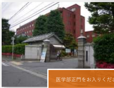
医学部正門をお入りください。