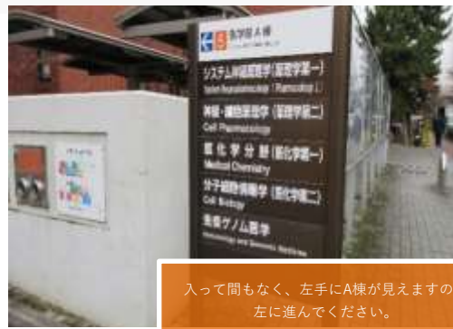
入って間もなく、左手にA棟が見えますので左に進んでください。