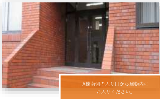
A棟南側の入り口から建物内にお入りください。

建物入ってすぐの階段、もしくはエレベーターで2階まで上がってください。 2階 東側 203号室が医学教育・国際化推進センター 事務室です。